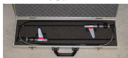
アルミニウム製ケース