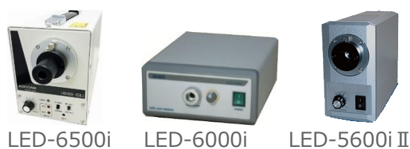
LED-6500i LED-6000i LED-5600i II